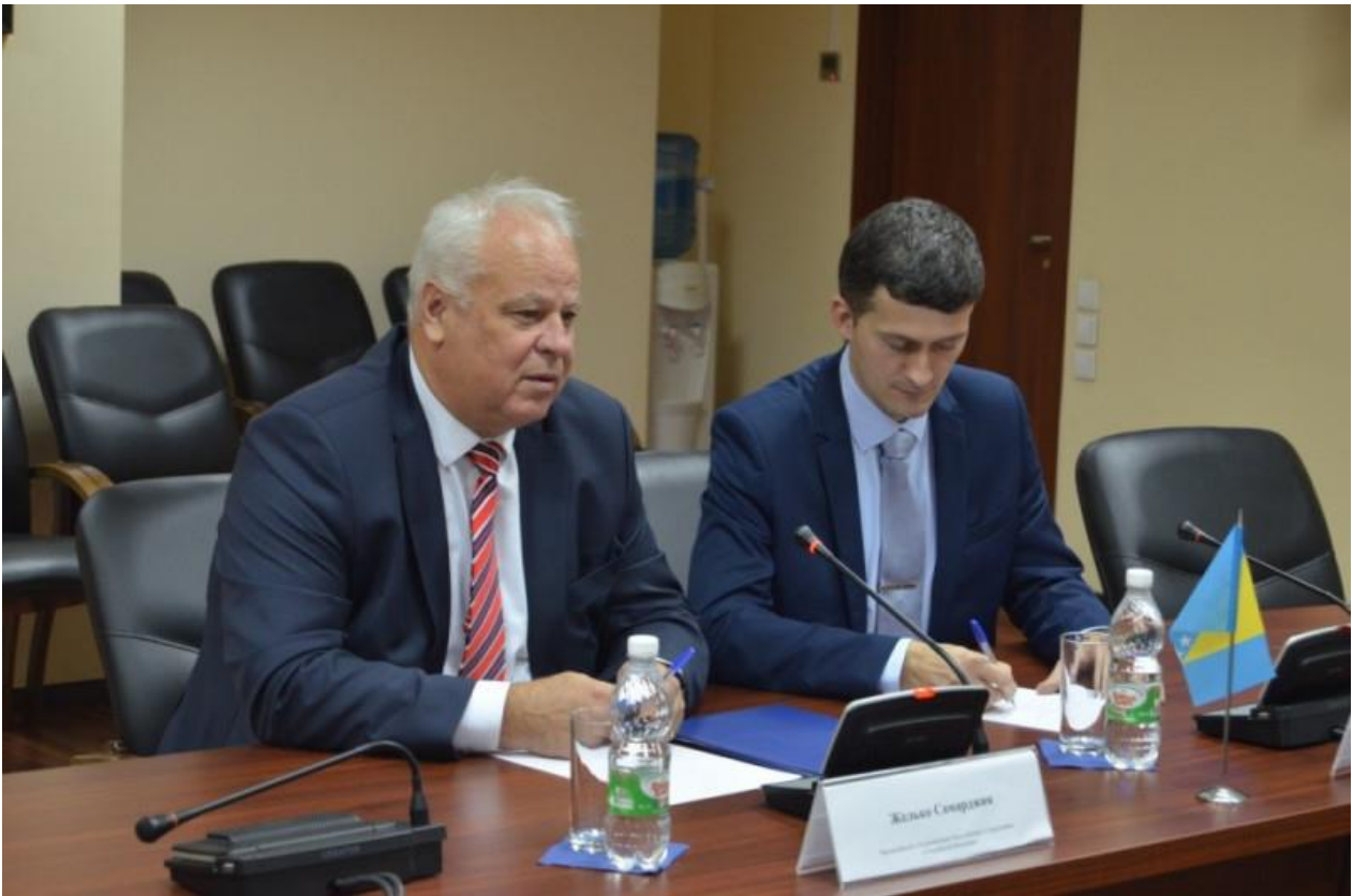
Чрезвычайный и полномочный посол Боснии и Герцеговины в России Желько Самарджия на круглом столе с нижегородскими экспортерами 29 сентября 2020 года