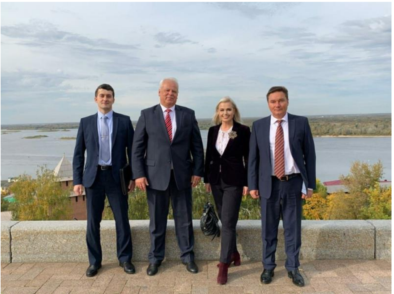
Визит чрезвычайного и полномочного посла Боснии и Герцеговины в России Желько Самарджии в Нижегородскую область для обсуждения участия боснийской делегации в 800-летию Нижнего Новгорода 29 сентября 2020 года