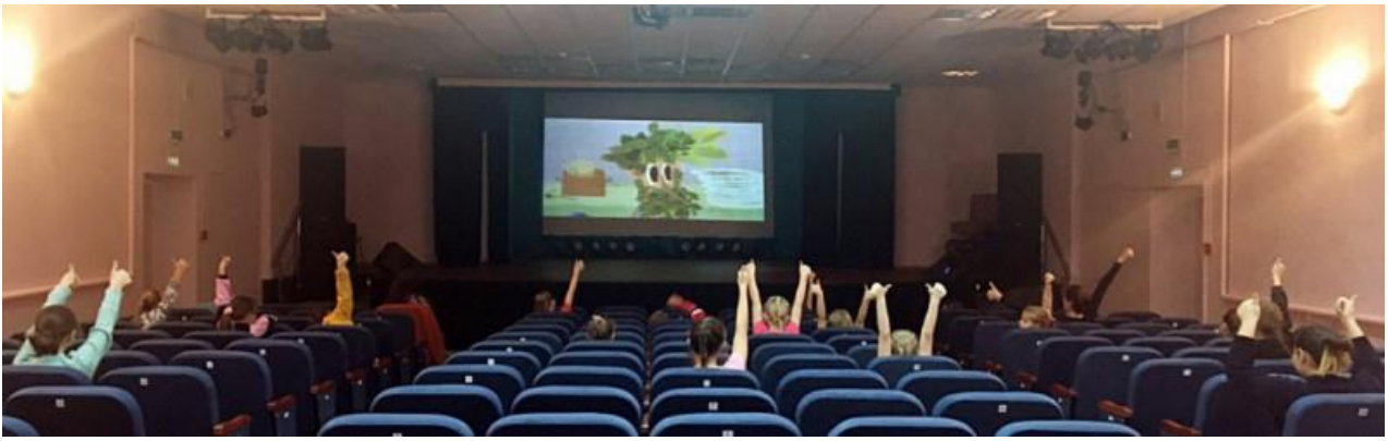
Бесплатные показы анимации на французском языке в культурно-досуговых центрах и библиотеках Нижегородской области в октябре 2020 года