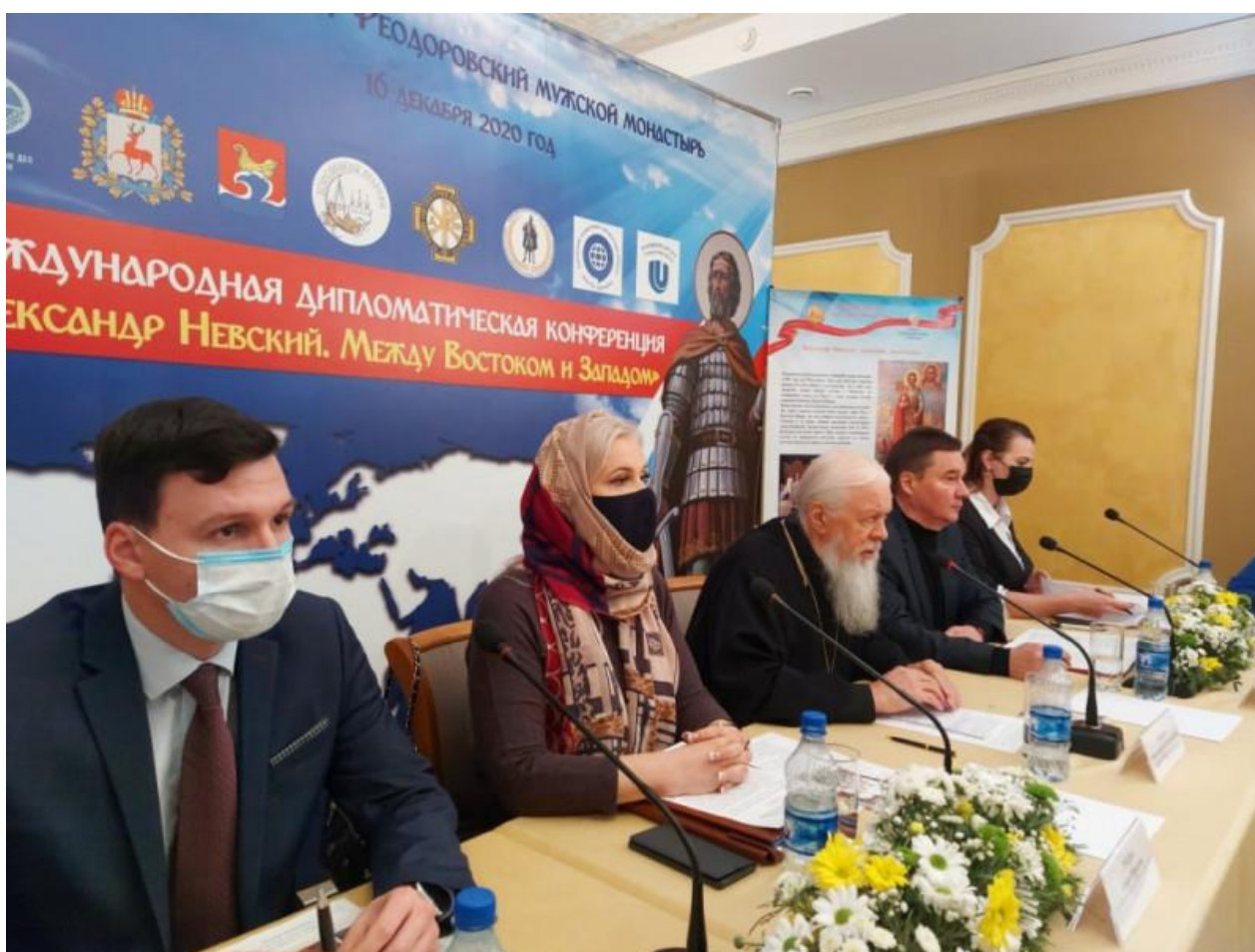
Международная научно-практическая конференция «Дипломатия Александра Невского. Между Востоком и Западом» в Городецком Феодоровском мужском монастыре 16 декабря 2020 года

В новом году Нижегородская область также отметит 800-летие со дня рождения великого русского князя Александра Невского. Знаменитый полководец принял монашеский постриг и окончил свой земной путь именно на нижегородской земле, в Городецком Феодоровском мужском монастыре.