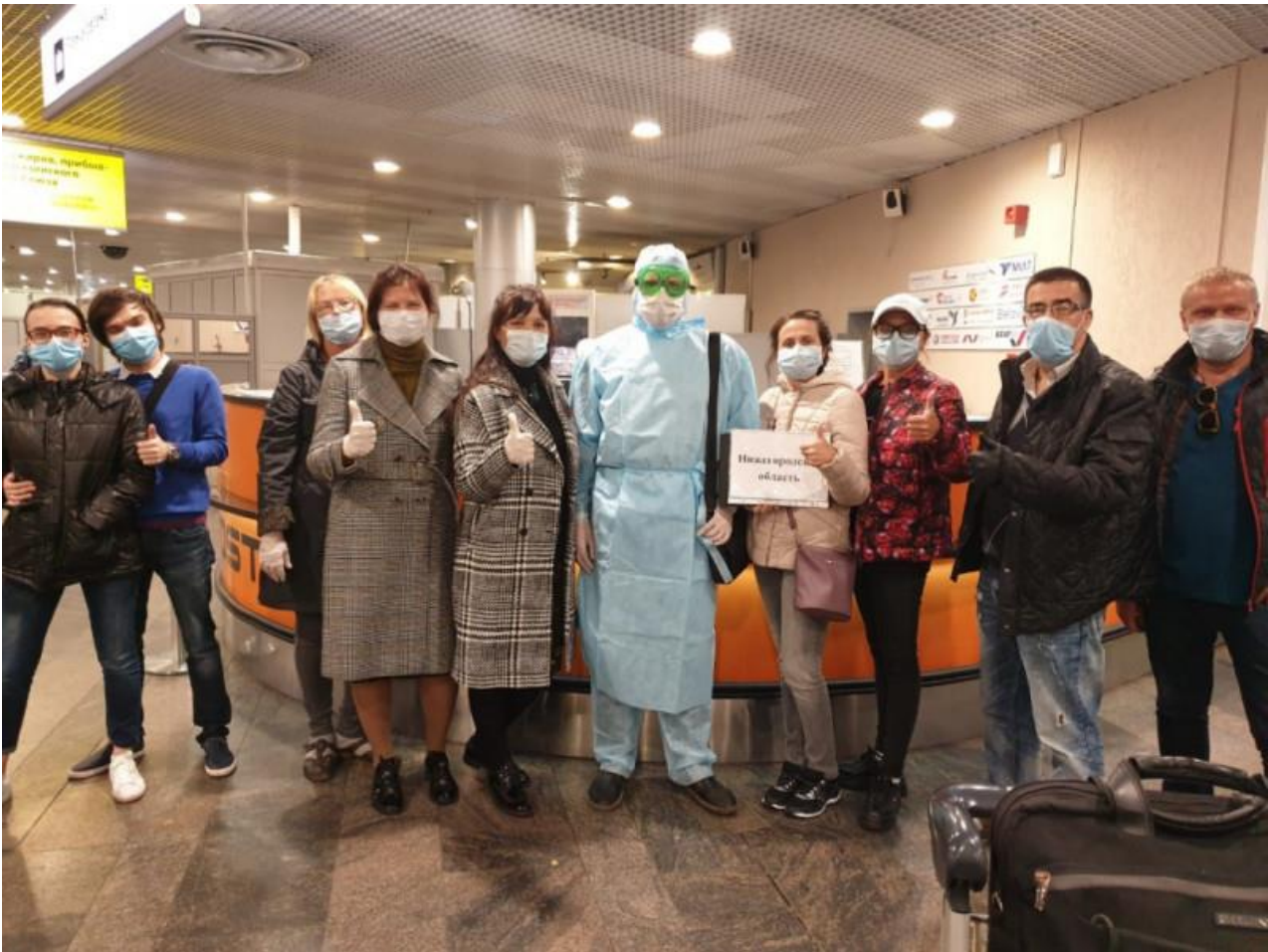
18 нижегородцев, прибывших вывозным рейсом из Танзании, ЮАР и Республики Маврикий в Москву 16 мая 2020 года

Итогом проведенной вывозной кампании стало возвращение на Родину почти 1 300 нижегородцев из 82 стран мира. Среди возвращенных на родину жителей региона были и те, кому потребовалась особая, адресная помощь: многодетные семьи, беременные женщины, новорожденные и малолетние дети, пожилые люди, а также люди с ограниченными возможностями здоровья, хроническими заболеваниями и инвалидностью.