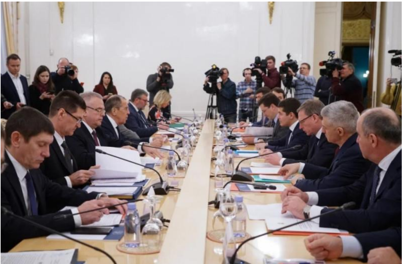
Выступление губернатора Нижегородской области Глеба Никитина на XXXIV заседании Совета глав субъектов Российской Федерации при МИД России 21 января 2020 года

Более того, в настоящее время опыт Нижегородской области используется в работе по совершенствованию федерального закона об МСУ.