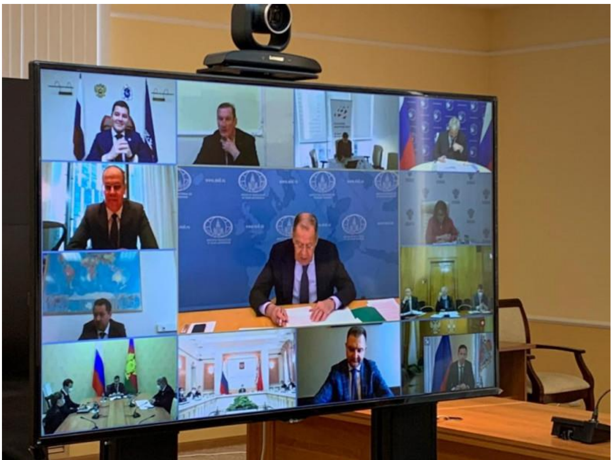
XXXV заседание Совета глав субъектов Российской Федерации при МИД России в формате онлайн 9 декабря 2020 года