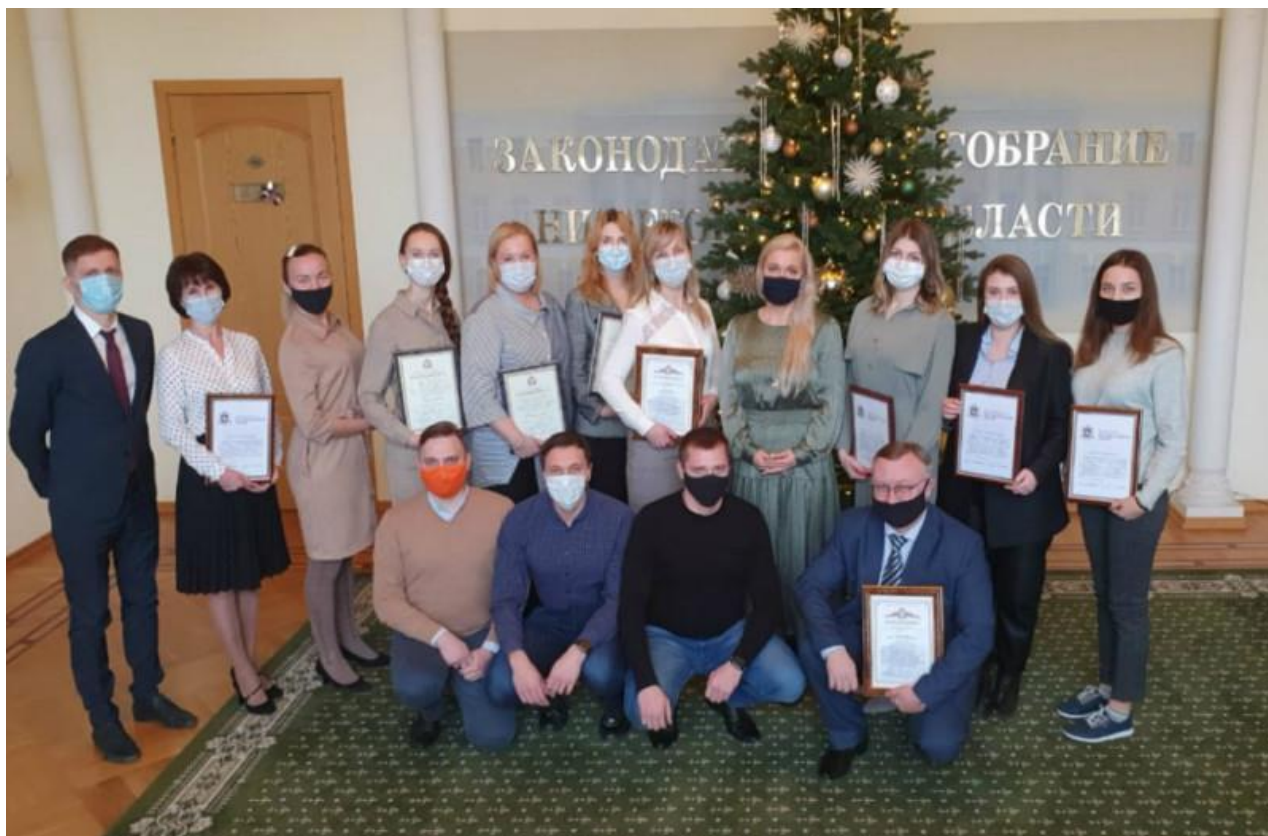
Сотрудники департамента с наградами за участие в кампании по вывозу нижегородцев, оказавшихся заблокированными за рубежом

Хочется также выразить большую благодарность коллегам из представительства МИД России в Нижнем Новгороде, управления Роспотребнадзора по Нижегородской области и ГУ МВД России по Нижегородской области за непрерывное и слаженное взаимодействие в деле спасения наших земляков. Тот результат, которого удалось достичь, — наша общая заслуга.